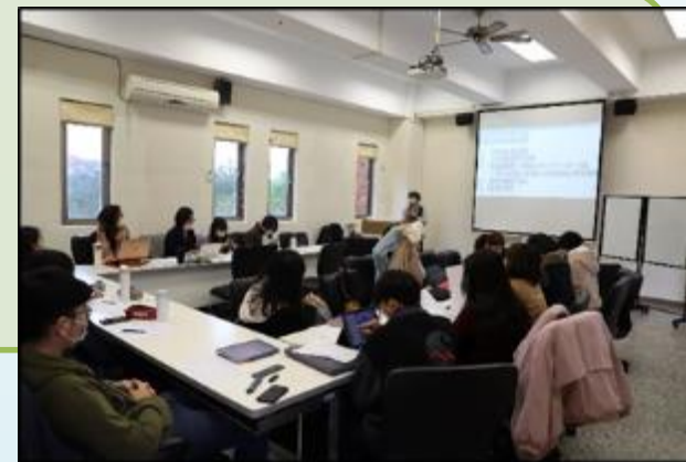
111年度UCAN種子講員培訓課程