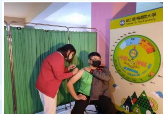
111/3/7第三劑莫德納疫苗