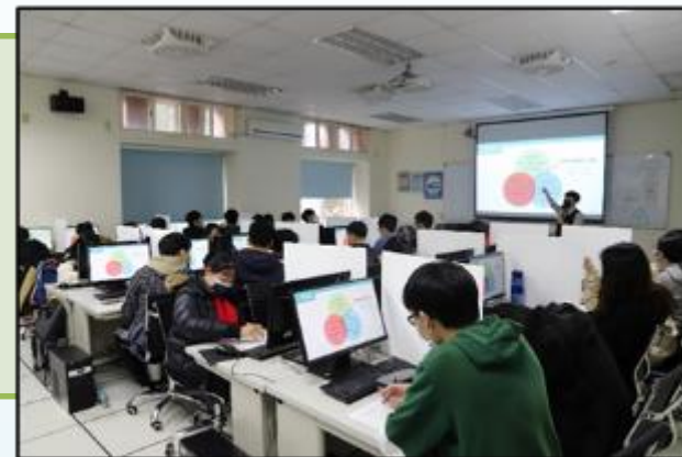
資工系入班活動-UCAN導入升學及就業準備